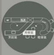
餐桌為行為後的目標