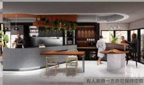
有人來時一方亦可保持空間