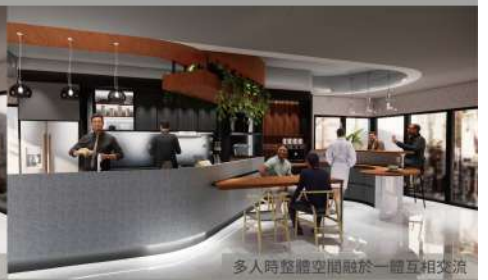
多人時整體空間融於一體互相交流