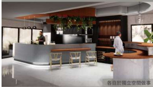
各自於獨立空間做事