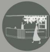
使用流理臺和植栽作為 空間隱形之區隔