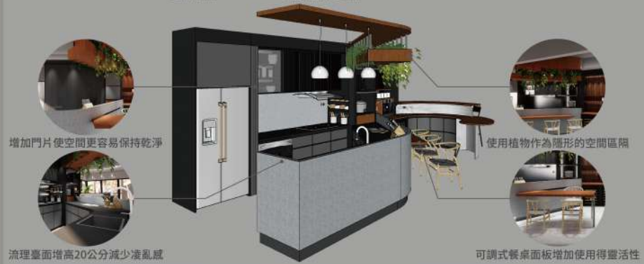
增加門片使空間更容易保持乾淨