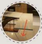
桌面可垂直延伸，親友聚會享生活。