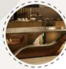
開放式收納櫃，收藏兩人珍貴回憶。