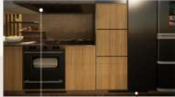
自動抽油煙(偵測油煙) 地板除濕(偵測濕氣)