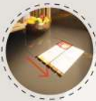
食譜搜尋面板，隱藏式可避免污漬。