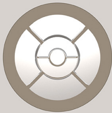
水槽操作鈕 按鈕功能(由裡至外) 回復至平面、升降、傾斜方向