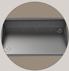
矽膠隨金屬板升降、傾斜，從四周往下延伸

不使用水槽時，可作為平台增加工作臺面積。 水槽可隨使用者需求透過油壓桿升降、傾斜，方便清洗鍋具、食材，洗手時也可避免水花濺出。